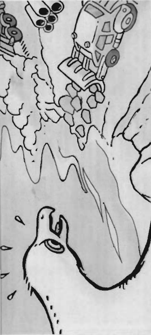
ILLUSTRATION HIPPO 7 © PIERRE BLANCHARD

« Espérons que la prochaine fois ils feront attention », soupire Petit Hippo, héros malmené par les hommes urbanisant le littoral.