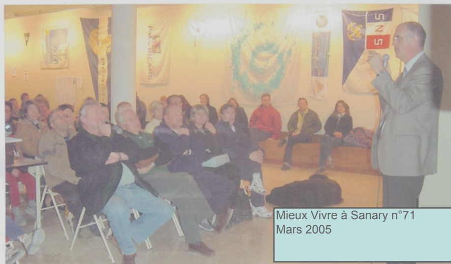
Mieux Vivre à Sanary n°71 Mars 2005